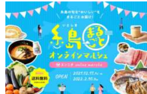
官民連携による糸島産品のネット通販