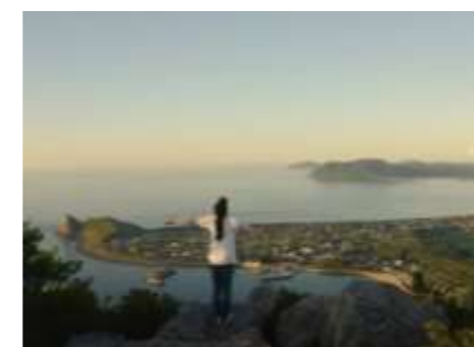
自然環境の保全や快適な暮らしの維持