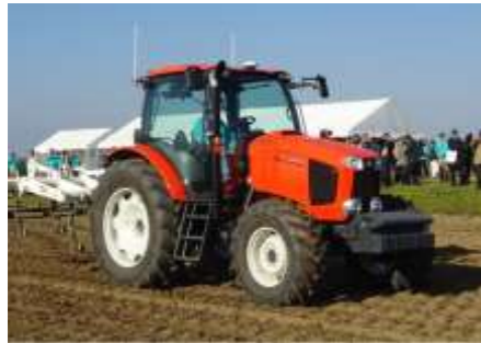
自動操舵による農業用機械