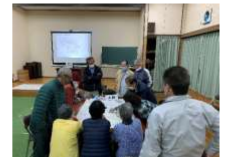
地域での自主防災活動の促進