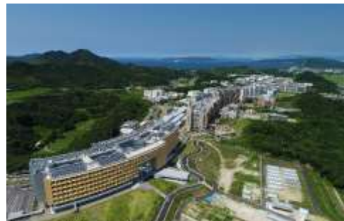
九州大学周辺サイエンス・ヴィレッジの整備