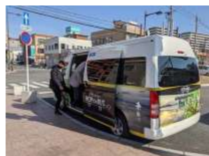
観光周遊バス「HOP ON BUS」