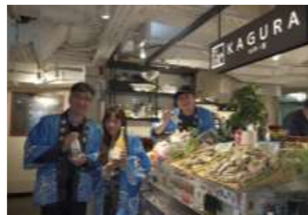
糸島産品の海外販路開拓イベント