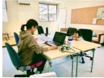
子育て世代のテレワーク