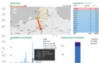
官民連携によるビッグデータやAIの活用