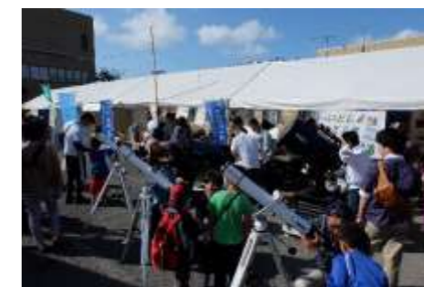
子ども向け天体観測会