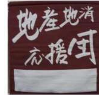
地産地消店舗の拡大支援