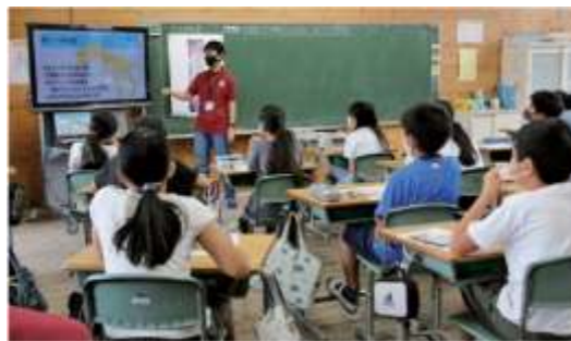
大学生による小学校での授業