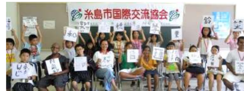
子どもの国際交流の推進