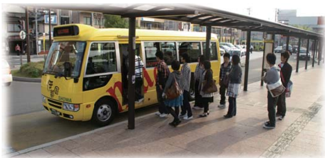
糸島市コミュニティバスに乗る九州大学生