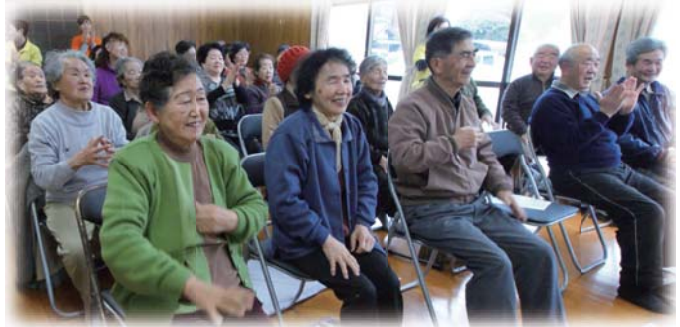
高齢者健康講座 (二丈福井)