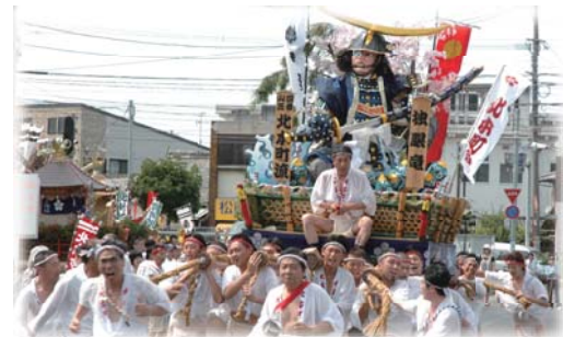
前原夏祭り（前原校区）

地域の抱える課題を地域住民みずからが解決していくため、小学校区を単位として、それぞれの地域特性を生かした校区まちづくりを推進します。併せて、NPO など多様な主体による協働のまちづくりを進めます。