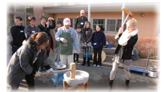
九州大学留学生との交流会（東風公民館）

九州大学の世界トップレベルの知的資源、若い学生の活力、国際性の豊かさなどを生かして、大学と地域が互いに助け合いながら、一緒になって地域づくりに取り組みます。