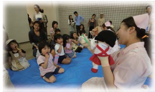
歯の健康のつどい（伊都文化会館）

少子高齢化が進む中、糸島の未来を担う子どもたちが健やかに成長できるよう、安心して子どもを生み育てられる環境づくりを進めるとともに、学校、家庭、地域が一体となり、子どもたちの健全育成に取り組みます。