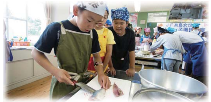
さかなっ子調理教室（引津小学校）