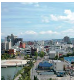
都市的整備ゾーン

また、出土品群が国宝に指定されている平原遺跡をはじめとした史跡など、多様な地域資源を生かし、本市の歴史と文化を感じることでできる拠点の形成を図ります。