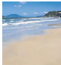
玄界灘海岸ゾーン