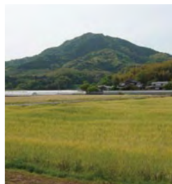
農業・農村振興ゾーン