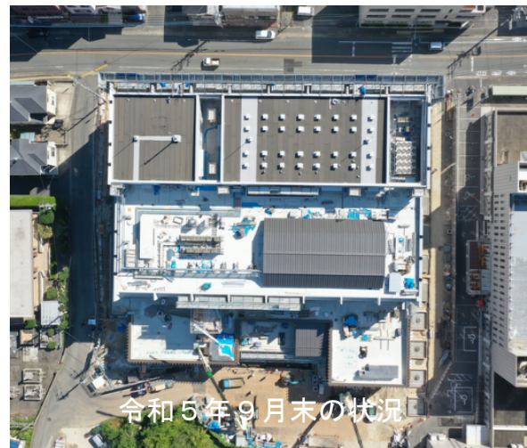
令和5年9月末の状況

現在、内部の仕上げ工事、外構工事を毎日約200名の現場監督、作業員が参加し進めています。竣工に向けて急ピッチで出来上がっています。来年1月の開庁日に皆様にお披露目できる日を楽しみに頑張っています。