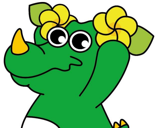
【 令和6年度 採用試験スケジュール 】