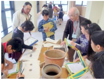
土器や石器などを実際にまじかで見くらべながら学習します