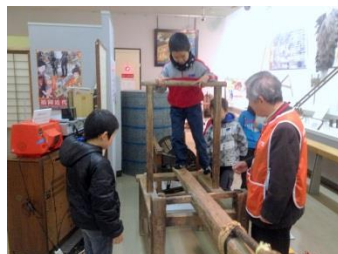
昔の道具を実際に体験します