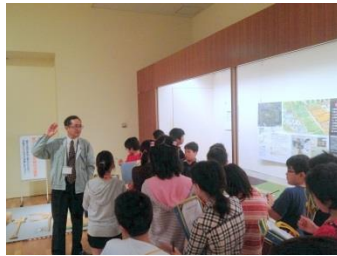
展示を見せながら、くらしと道具の変化を学芸員がわかりやすく説明します