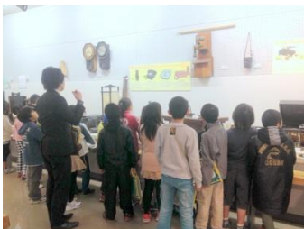
学芸員による昔の道具の説明