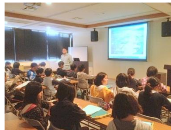
干拓の経過を地図などの映像を見せながら説明します

江戸時代におこなわれた干拓の歴史を、残っている絵図や現在の航空写真などを見ながら学習します。干拓以外にも校区ごとの歴史・テーマに応じて、資料を使い分けながら、その地域の歴史についてわかりやすく解説します。