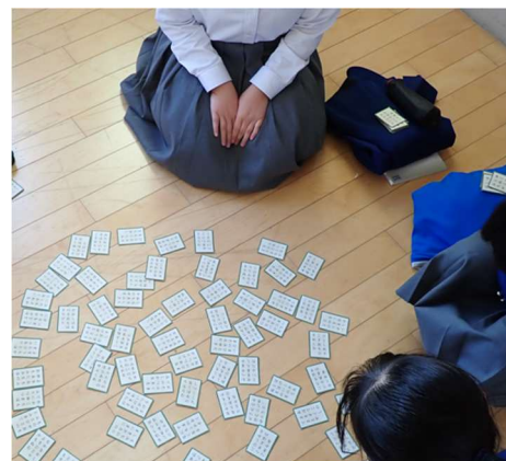
百人一首をしよう