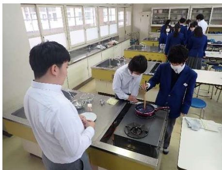
色が変わる焼きそばづくり