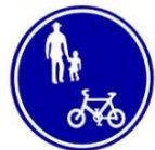
自転車及び歩行者専用

志摩中学校区の道路の多くは歩道が自転車通行可となっています。みなさんの安全のため歩道を走行しましょう。ただし、歩行者優先です。また、追い越しのために車道へ突然飛び出して車と接触する事故が多発しています。大変危険ですので注意しましょう！