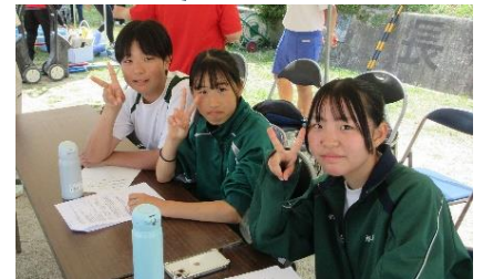
【長糸小学校運動会 放送担当】

【長糸小学校運動会】5月25日（土）前日準備参加者 9名 26日（日） 当日参加者14名