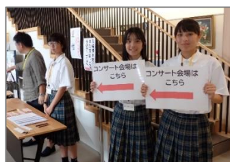
【ふれあいコンサート】

前原南小学校体育館において、22名の生徒が災害 発生時の避難所運営のボランティアに参加しまし た。