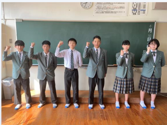
(ブロックリーダー会の様子)

残念ながら、保護者の参観なしの半日開催となりましたが、子どもたちの熱気が地域に伝わるように、体育祭が終わって家に帰って「体育祭最高に良かった」と感動の声が聞けるように取り組んでいきます。