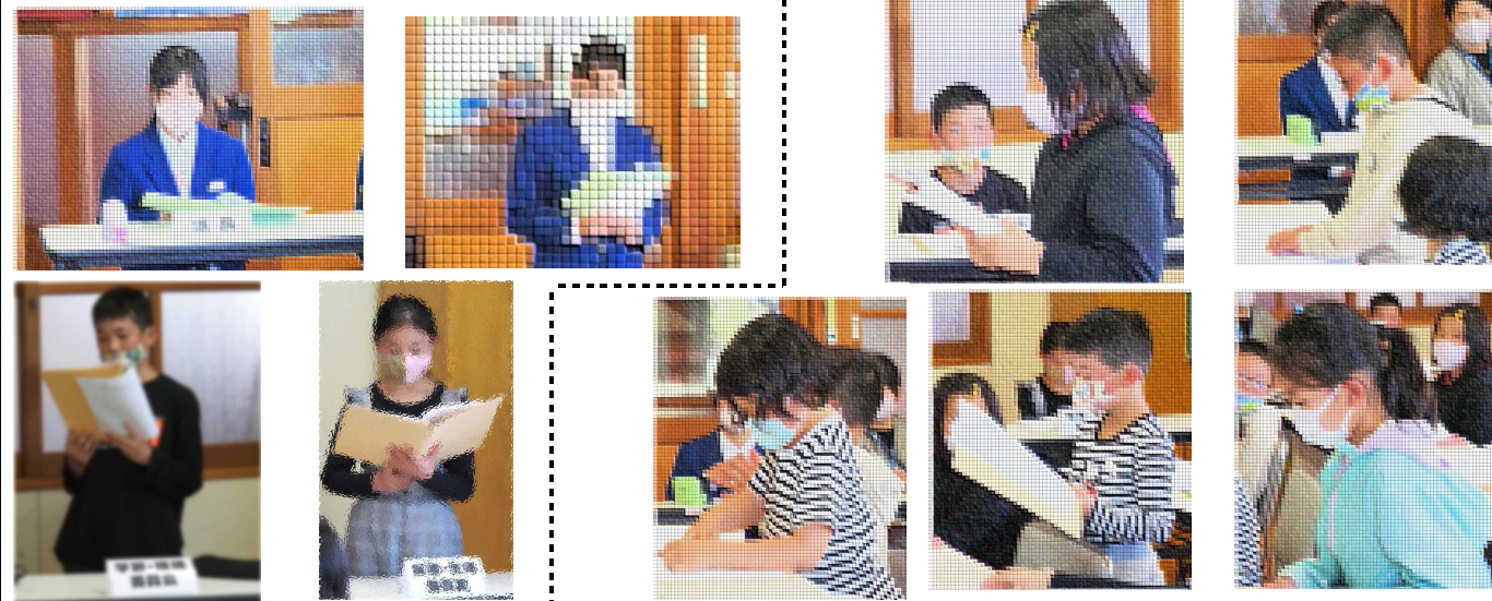
【進行】中学生 【提案】5年生