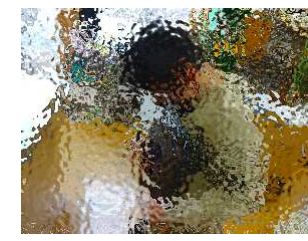
2年生：図工で作品のヒントになるものを撮影しているところ