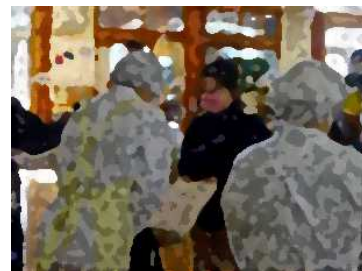
【給食に関わる方々にプレゼント(加ガ)を渡しています。】

本年度は、校内のみでの給食感謝の会となりましたが、子どもたちは、給食について学習したことをもとに事務の先生、調理員の先生方へ感謝の気持ちを伝えました。