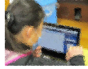
4年生：国語で問題を画面に直接書き込んでいるところ