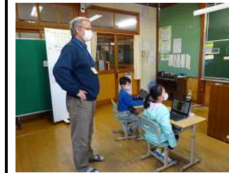
低学年：外国語の学習で画像を見て英語の発音練習しているところ