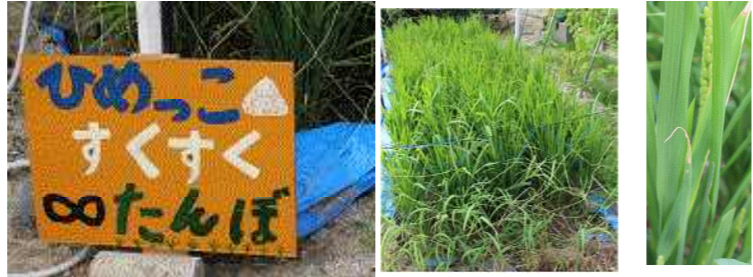
8月末の稲の様子です。(穂も見え始めました)

本年度は、新型コロナウイルスの対応で、夏休みが短くなりましたが、子どもたちは8月20日から元気いっぱい学習をスタートしています。