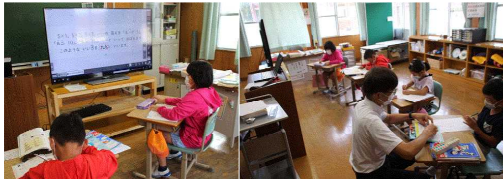
画面を見て、学習している2年生（左）と指導者（教頭）と学習している1年生（右）の様子です。↑

算数の学習の様子です。指導者が1年生について教えているとき、2年生は、デジタル教科書の画面を見ながら各自で学習を進めています。提示された問題などをあきらめることなく、負けずにやりぬくことが大切です。