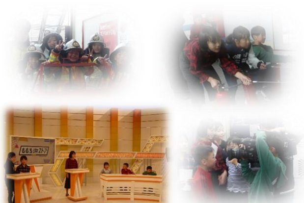
「百道浜ストア」スタジオ体験

その後、百道浜で仲良くお弁当をいただき、TNC 会館を見学するというめったに経験できないことを楽しんできました。