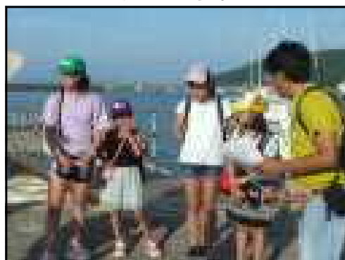
【出発：大丈夫かな・・・】

昨年の経験もあって、分からない時は案内板を見たり、駅員さんに尋ねたりして2チームとも目的地まで行くことができました。「自分で考え、判断する力」は、今後の学習や生活にも大切な力です。