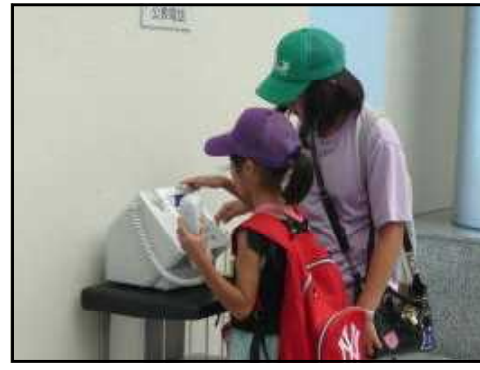
【「無事についたよ」と電話】