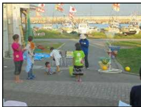
【小学校：バスケットボール】

明日から夏休みに入ります。夏休みしかできないことをたくさん体験してほしいと思っています。健康に気をつけて楽しい夏休みを過ごしてくれるよう願っています。★