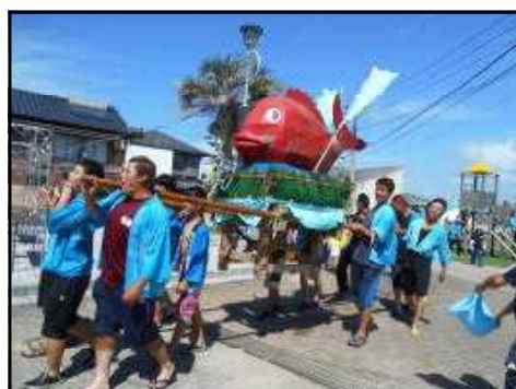
【大人に人気の鯛神輿】