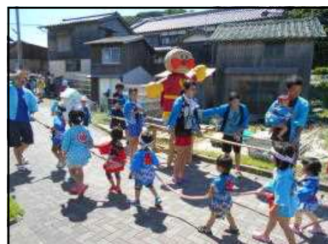
【子どもに人気のアンパンマン神輿】