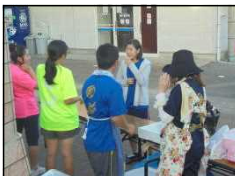
【中学生：食品コーナー】