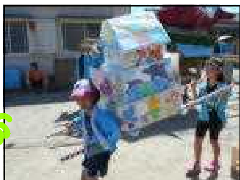
【小2が作成した御神輿】