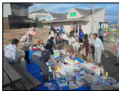
【中学校：物品コーナー】