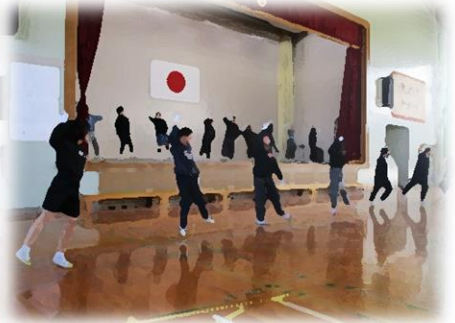
5年生「6年生との思い出 シャル・ウィ・ダンス？」