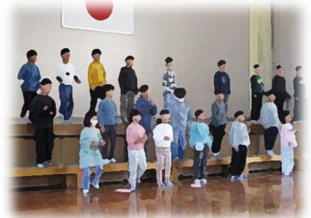
3年生「6年生ありがとう」