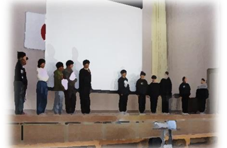
各児童委員長引き継ぎ式