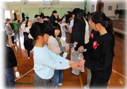
ありがとうプロジェクト (1年生からプレゼント)