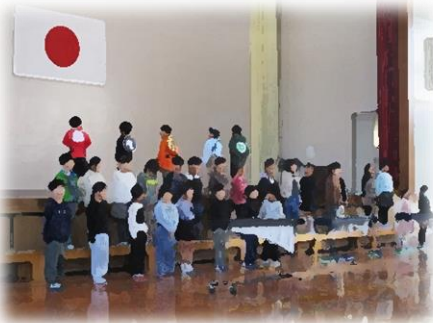
1年生「ありがとうレンジャー」