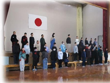
4年生「背中が教えてくれたこと」