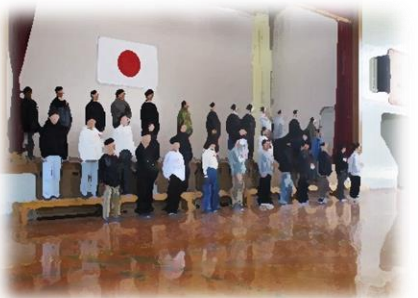
6年生「39通のありがとう、 そして未来への決意」