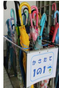
6月18日 1年1組さん 3回目 かさがきれいにたんでならべて ありました 見ていてとても気持ちがいいです。 すばらしい！！ 校長先生より