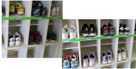
5年1組 くつばこ美術館賞 きれいにくつが並んでいます。気持ちがいいね！！ 達成おめでとう がんばったね 校長先生より