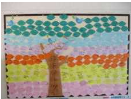
【5年生からメッセージ渡し】