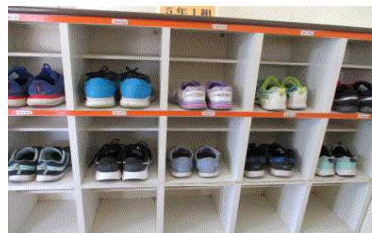
5年1組 くつばこ美術館賞

きれいにくつが並んでいます。気持ちがいいね！！ たっせいおめでとう がんばったね 校長先生より