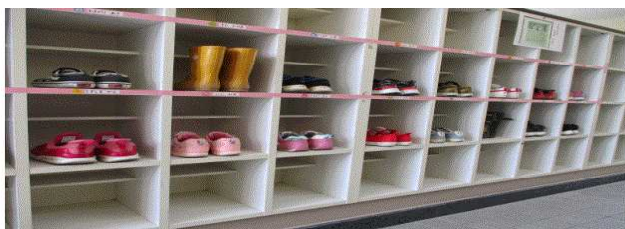
1ねん2くみ くつばこ美術館賞

きれいにくつが並んでいます。気持ちがいいね！！ たっせいおめでとう がんばったね 校長先生より