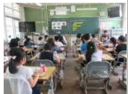
【机の間隔をあけて】

○職員で、各教室、手洗い場、スイッチ、ドアノブ、トイレ等毎日定期的に（1日3回）消毒をします。