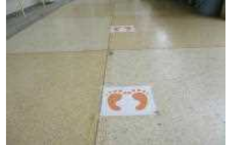
【密にならないよう足跡掲示】