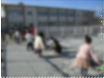
【1年生からのプレゼント渡し】