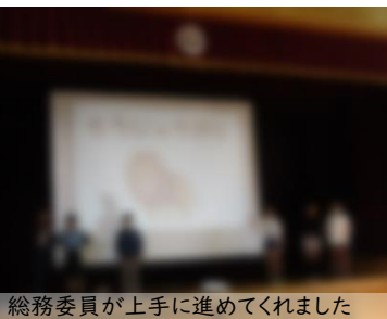
総務委員が上手に進めてくれました