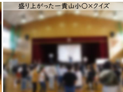
盛り上がった一貴山小〇×クイズ

そして、お迎え遠足。今年も長系小学校までの道のりを1年生と6年生のペア、2年生と5年生のペア、3年生と4年生はそれぞれで歩いていきました。