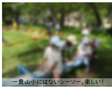
一貴山小にはないシーソー。楽しい!

特に6年生は1年生の手を引き、時には荷物を持ってあげたりおんぶをしてあげたりし、お兄さんお姉さんとして頼もしい姿を見せてくれました。 少々暑い中の遠足でしたが、気持ちよく歩き、仲を深めることができました。