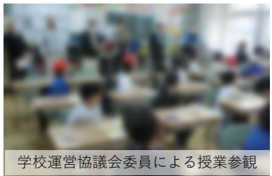
学校運営協議会委員による授業参観

12月12日(火)に開催。学習参観のあと、「Iファミリー・Iコミュニティ」の取組結果(学校だより12月号②に掲載)と学校の自己評価結果を学校より説明し、意見交流を行いました。委員の皆様からいただいたご意見は以下の通りです。