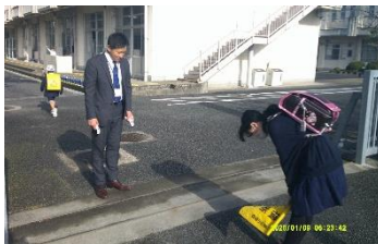
【礼儀正しい 気持ちのよいあいさつ】