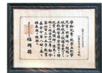
【福岡県第一号の旌表旗と 旌表旗表彰状】