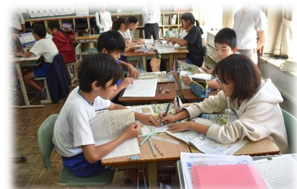
6年生社会「武士による政治の安定」