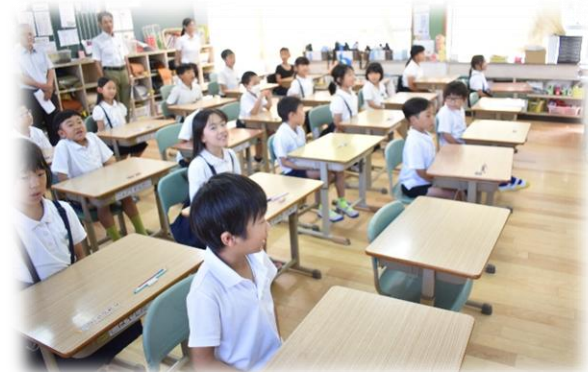
2年生国語「前期に頑張ったこと（作文）」

10月1日水曜日の5時間目に、児童の様子を参観してもらいました。どの学級も落ち着いて学習する姿が見られ、学校運営協議会委員の皆様も感心しておられました。