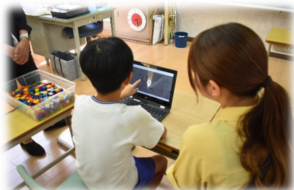
きらり1組「ローマ字」