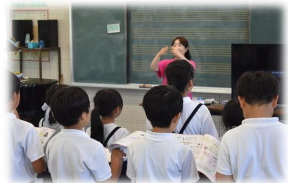
4年生音楽「旋律の特徴を感じ取ろう」