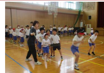
↑1年生に大なわを教える3年生の様子