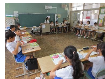
↑5年生学級活動の様子