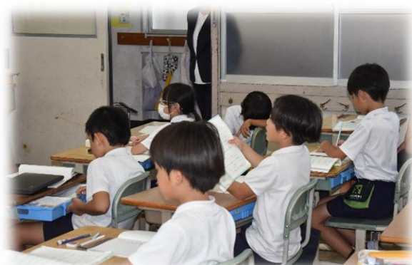
3年生国語「ローマ字」