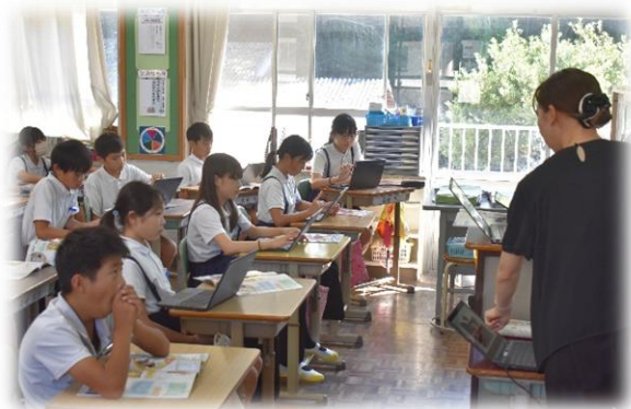
5年生図工「学校おすすめガイド」