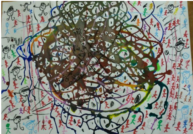
【2年 クレマデス海上 なおさん】

第70回福岡県児童画展において、本校児童が県特選1名・入選2名・佳作12名、糸島市入選6名、受賞しました。その中から、県の「特選」「入選」に選ばれた作品を紹介いたします。(カラー版はHPに掲載しています)