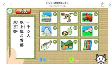
【資料2】ピンゴ! 都道府県かるた