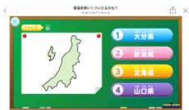
【資料1】都道府県いくついえるかな?