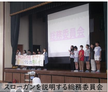
スローガンを説明する総務委員会

6月11日(水)は第1回目の南風朝の会。 南風朝の会は、児童会活動の活性化のため、年4回計画されています。 児童会活動は、楽しく、安全に、安心して過ごすことができる南風小にするために5、6年生が中心となって自主的に取り組む活動です。 今回は、各委員会の委員長より委員会の取組紹介と総務委員会からの本年度のスローガンや学校全体での取組の紹介でした。 各委員会の自主的な取組が期待されます。