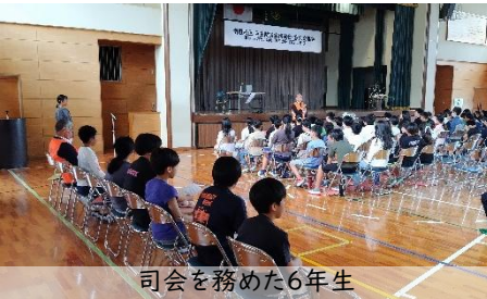
司会を務めた6年生