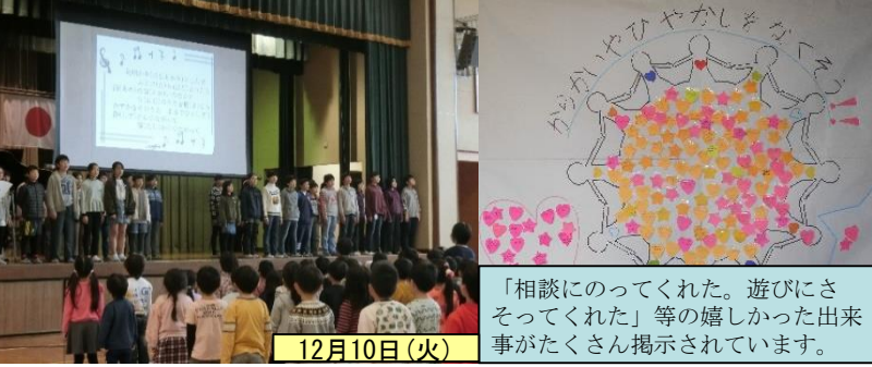
「相談にのってくれた。遊びにさそってくれた」等の嬉しかった出来事がたくさん掲示されています。