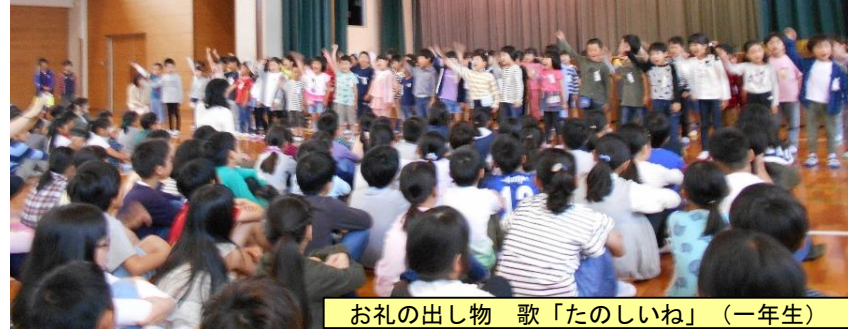
お礼の出し物 歌「たのしいね」(一年生)