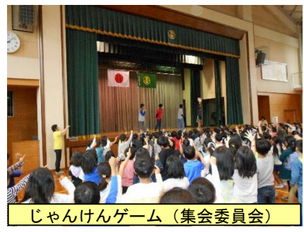
じゃんけんゲーム (集会委員会)

遠足当日は、あいにくの雨天で、校内遠足となりました。しかし、お迎え集会では、全校呼びかけや歌、集会委員会からのクイズ等で大変盛り上がりました。お弁当の日の取組への御協力、有り難うございます。