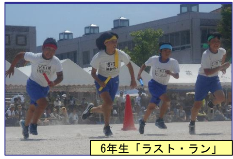
6年生「ラスト・ラン」

子どもたちの夢や願いが込められた色取り取りのバルーンが空高く舞い上がる光景は大変美しかったです!