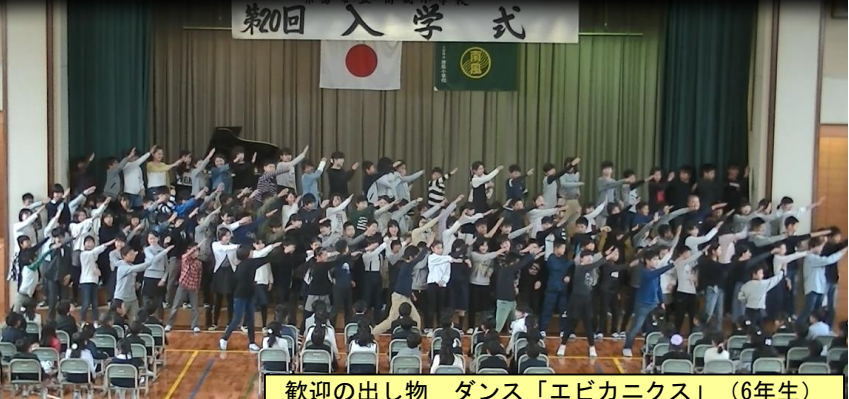
歓迎の出し物 ダンス「エビカニクス」(6年生)

本年度は73名の新一年生の入学です。1年1組・2組・3組の担任の先生から呼名された新一年生は「はい！」と元気に返事をすることができました。