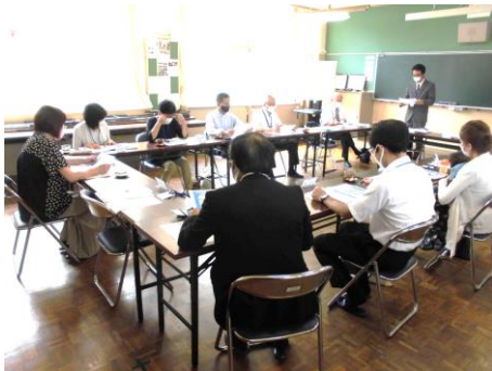
〔学校運営協議会の様子〕

臨時休校や感染症拡大防止のため、開催が遅れていた学校運営協議会をようやく実施することができました。コロナ禍でも取り組むことができる、本年度の3大プロジェクトについてもご意見をたくさんいただき、今後、組織や運営面から具体的に計画を進める予定です。地域、保護者の皆様にも御協力・御支援をいただき取り組みの充実を図って参りたいと思いますので、よろしくお願いいたします。