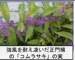
強風を耐え凌いだ正門横の「コムラサキ」の実

台風9号・10号の接近で、市内の小中学校は授業カットや臨時休校となりました。コロナウイルス感染防止や熱中症対策に加え、様々な危機管理が求められている中、保護者・地域に皆様には、子どもたちのために御理解、御支援をいただき心から感謝申し上げます。登下校中の見守りやあいさつ(英語のあいさつ)、スクールヘルパーさんによる樹木の剪定、シニアクラブさんによる除草作業等々、子どもたちの安全・安心、学びの環境を整備して下さい有り難うございます。