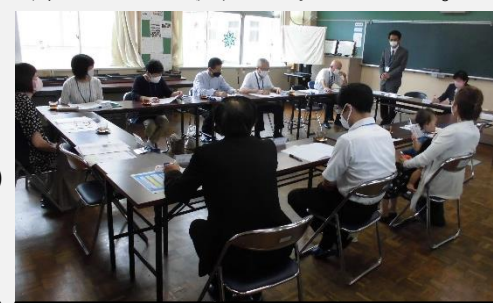
協議会の詳細は、南小C.S.だより ~スクラム南~ でお知らせします。