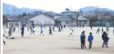
寒さに負けずに昼休み外で遊ぶ子どもたちの様子

2月に入るともう、本年度の終わりの見えてきます。本年度のまとめと次年度への準備をしていきたいと思ひます。2月もよろしく願ひます。