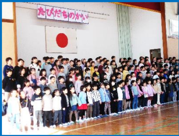
6年生との思い出ベスト3の発表と「手をつなごう」を合唱しました。