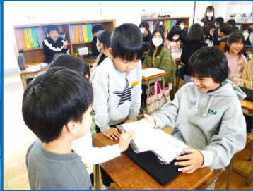
1年生は、自分とお世話になった6年生の似顔絵を描いて、プレゼントしました。