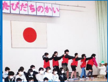
寸劇「大きなかぶ」で在校生へのメッセージを伝え、ハンガリー舞曲第5番を合奏しました。