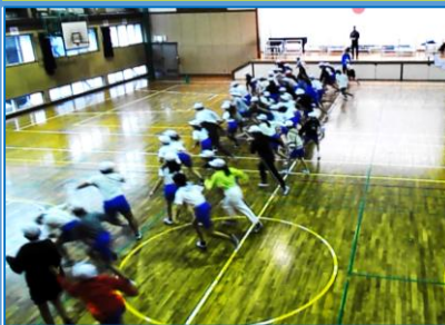
瞬発力を高める運動「猫とねずみ」

アプローチレッスンとは、6年生が中学校の先生の授業を受けたり、中学校の学校説明を聞いたりすることを通して、進学への心構えをもつことを目的として毎年実施されている前原中学校区の取組です。