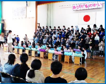
呼びかけ、合唱「いつだって」、合奏「A Whole New World」を披露しました。