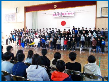
思い出の寸劇と「マイバラード」, 「ビリーブ」を二部合唱しました。