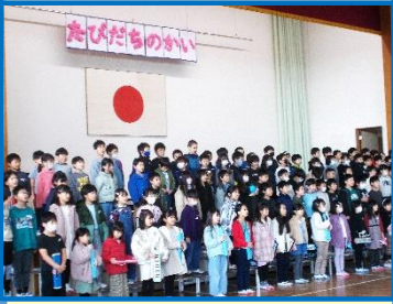
体育館中に響き渡る元気な声で「手のひらを太陽に」を合唱しました。