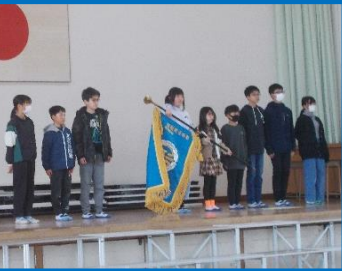
総務委員会の6年生から5年生へ南小の伝統「あすなろ」が引き継がれました。