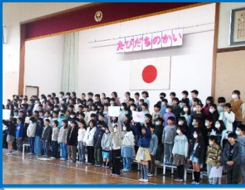
好きなもののクイズをしたり、「TOMORROW」を手話を交えながら合唱したりしました。