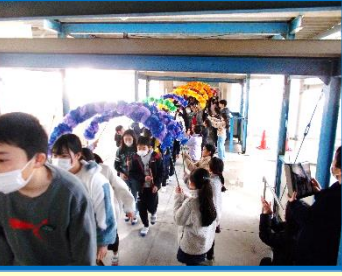
赤青黄緑 (ブロック色) の花アーチをくぐり、体育館にお迎えしました。