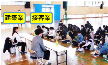
説明に聞き入る子どもたち

ゲスト・ティーチャーが仕事を選んだ理由（好きや得意）や仕事の楽しさ、辛さを聞くことで、自己実現や社会貢献することの素晴らしさに気づいていきました。