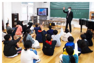
質問に答える子どもたち

説明の中では、税金の使い道は皆さん（国民）が決めることだから、18歳になったら選挙に行き、皆さんで選んだ議員さん達に、税金のルールを決めてもらうことが大切であると話されました。