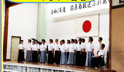
コールみなみの合唱

11月4日（土）は、4年ぶりのステージ発表でした。児童数の増加で、全児童が体育館に入ることができないので、低学年・中学年・高学年に分かれての発表となりました。本校の子どもたちからは、歌や合奏、呼びかけを、地域からは、6つのサークルからの発表がありました。