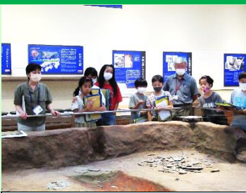
展示物を見学する様子

志摩歴史資料館では、糸島の伝説や昔の生活についての話を聞いたり、海と関わりのある様々な遺物を見学しました。