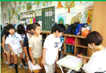
赤ペン先生による丸付け