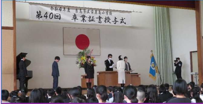
証書授与の様子（本校体育館）

3月17日（金）第40回卒業証書授与式を行いました。子どもと教師はマスク着用を自己判断で臨んだ卒業式でした。返事や校歌斉唱の際、それぞれの子どもの思いがうかがえる感動的な式でした。（保護者、来賓にはマスク着用をお願いしました。）