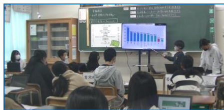
ディベート学習の様子(6年3組)

子どもたちが, 金融教育を通して, 「物を大切にする」「勤労に感謝する」「消費者トラブルから身を守る」など学び, 生涯を通じて役に立つ力の基礎を育むよう取り組んで参ります。