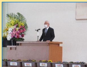
菰田区長会長挨拶

南校区の温かい雰囲気大好きです。校区の温かい雰囲気が続くように、自分から挨拶をしたり、困っている人に声を掛けたりしていきたいです。