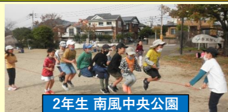
2年生 南風中央公園