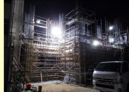
1階部分の躯体工事(壁・柱・床の工事)が終わり、2階部分の工事を行っています。