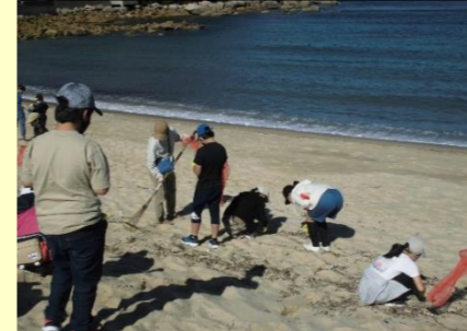
芥屋海岸で、ボランティア団体「くらげれんごう」と一緒に海岸清掃をしました。