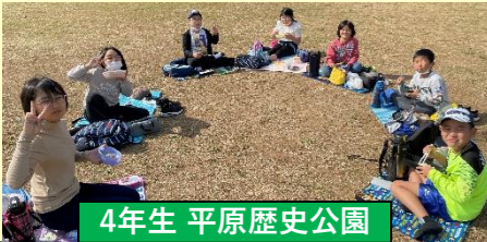
4年生 平原歴史公園