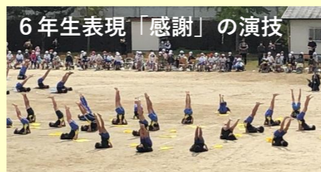
6年生表現「感謝」の演技

10月17日 (日) の運動会を御参観いただき有り難うございました。感染拡大防止のため、午前中開催とし、競技は各学年で2種目、また、各御家庭から2名までの御参観とさせていただきますが、皆様の御協力により滞りなく行うことができました。子どもたちは、目標を持って毎日の練習に頑張り、当日は、全力で走る姿、精一杯競技や演技をする姿が見られました。学校の行事を経験することで心も体も大きく成長できました。感染者が少なくなっているこの時期に、感染対策を継続しながら学習内容の充実や体験活動に力を入れていきたいと思ひます。