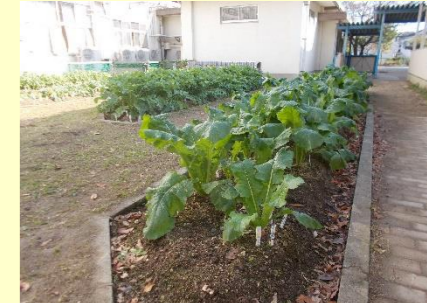
野菜名人の皆さんのお陰で、赤カブ、白カブ、大根、春菊が大きく育っています。