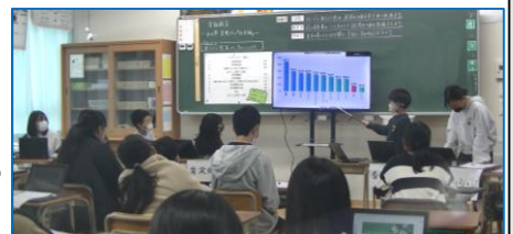
ディベート学習の様子（6年3組）

子どもたちが、金融教育を通して、「物を大切にする」「勤労に感謝する」「消費者トラブルから身を守る」など学び、生涯を通じて役に立つ力の基礎を育むよう取り組んで参ります。