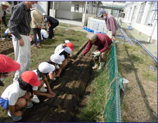
冬野菜の種まき (2年生) 10/13

保護者の皆様におかれましては、感染拡大防止に向けた取組「新しい生活」(3密回避やマスクの着用、毎朝の検温の実施、手洗いの徹底等)に、引き続き御協力をお願い致します。