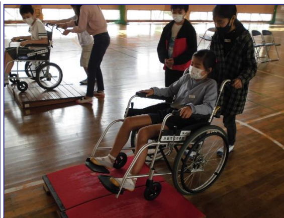
福祉学習 (5年生) 10/13

大根、白かぶ、赤かぶ、春菊の種を植えました。写真は、シニアクラブの野菜先生から、春菊の種をもらっている様子です。子どもたちは、一粒一粒の種を大事そうに植えていきました。