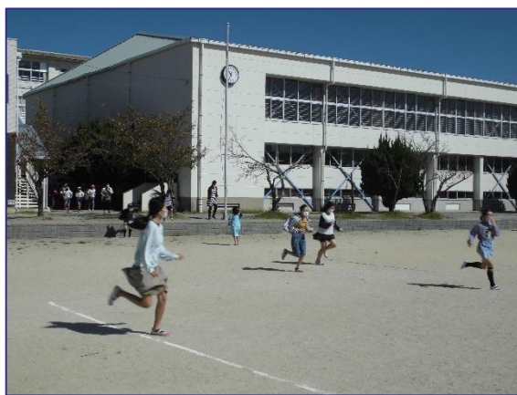
避難訓練 (火災想定) 10/7

福祉学習で、アマスク体験、手話体験、車いす体験をしました。写真は車いすで勾配のある道を通る模擬体験の様子です。障がいのある人や支える人の思いに触れることができました。