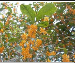
裏門横に薫る金木犀

今週から後期が始まりました。始業式は感染拡大防止のために校内放送を通して実施しました。まだ、児童全員が集まる集会や活動はできませんが、稲刈り、修学旅行、交通安全教室、遠足、分散による学習参観、ゲスト・ティーチャーの協力による学習、音楽の歌唱……等、感染拡大防止策を継続しながら、少しずつ体験活動や学習を再開していきます。