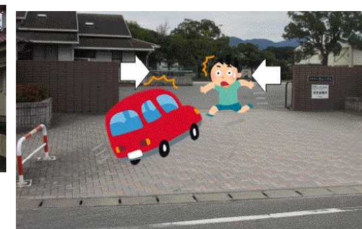
【正門付近における危険箇所】

子どもたちには「歩道から車道への飛び出し」や、「横断時の左右確認」等を学校でも指導していますが、御家庭でも重ねて、声掛けをお願いします。