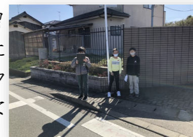
国語科:取材活動の3年生

学校では、ドリル学習を始め、学年の状況に応じて様々な場面でタブレット端末を活用しています。