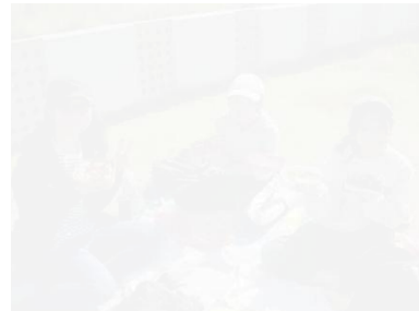
【高学年：系島市運動公園】