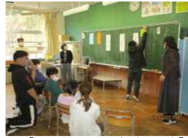
【ひだまり：自立活動】

2月17日（金）に学習参観を行いました。保護者の皆様におかれましては、お忙しい中に御来校いただき、誠にありがとうございました。子どもたちは多くの皆様に見ていただいたことで、いつもよりも意欲的にがんばることができました。廊下からの参観をお願いしていて、いつも申し訳なく思います。来年度は、きっと教室内でもっと子どもの近くで見ただけだと思います。